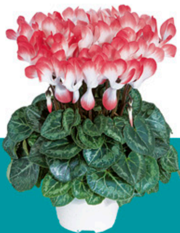
INDIAKA® Salmón - 53030 -