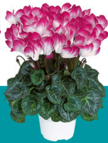
INDIAKA® Magenta - 53105 -