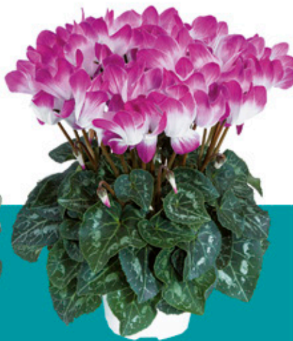
INDIAKA® Violeta - 53090 -