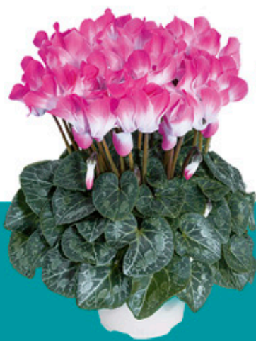
「音迪卡」 海棠红色 - 53070 -