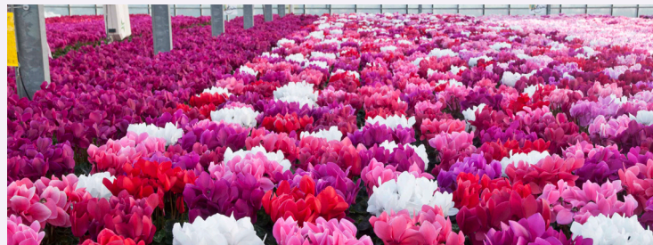
> Latinia® Success® Mix (ref. 1971), pot 12 cm, november, Noord Europa

De gesynchroniseerde bloei en de homogeniteit in de grootte van de planten maken nauwkeurige en gerichte verkoopacties mogelijk .