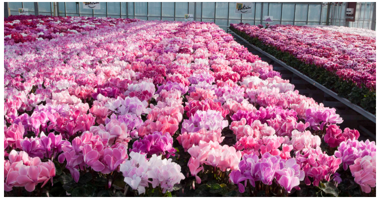
Latina® Flamed Mix (ref : 1910)

Twee Fantasie-variëteiten zijn perfect voor Latina® SUCCES® in termen van homogeniteit en gemakkelijke teelt: