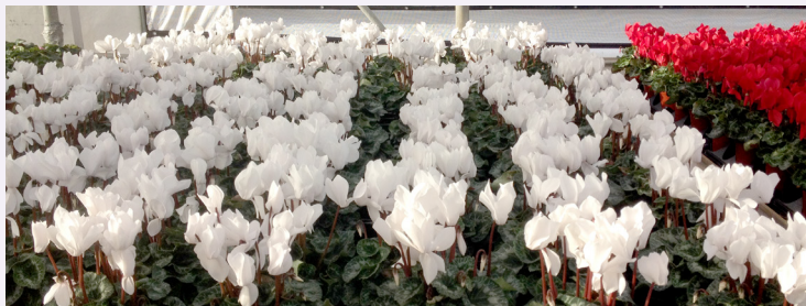
> Latinia® Success®, pot 10,5 cm, ADT* van 20°C-25°C, California

De bloei in 28 tot 30 weken vanaf het zaaien biedt u de mogelijkheid om grote bloemen te telen voor een verkoop vanaf het einde van de zomer. Benut uw kasoppervlakte beter door een tweede teelt grootbloemigen te plannen, zoals HALIOS®HD of HALIOS®, voor het tweede deel van de herfst.