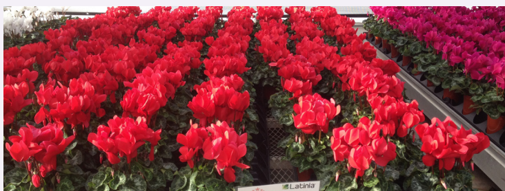
> Latinia® Success®, pot 10,5 cm, ADT* van 20°C-25°C, California

Het unieke assortiment zuivere en briljante kleuren levert industriële prestaties en beantwoord tegelijk aan de marktverwachtingen.